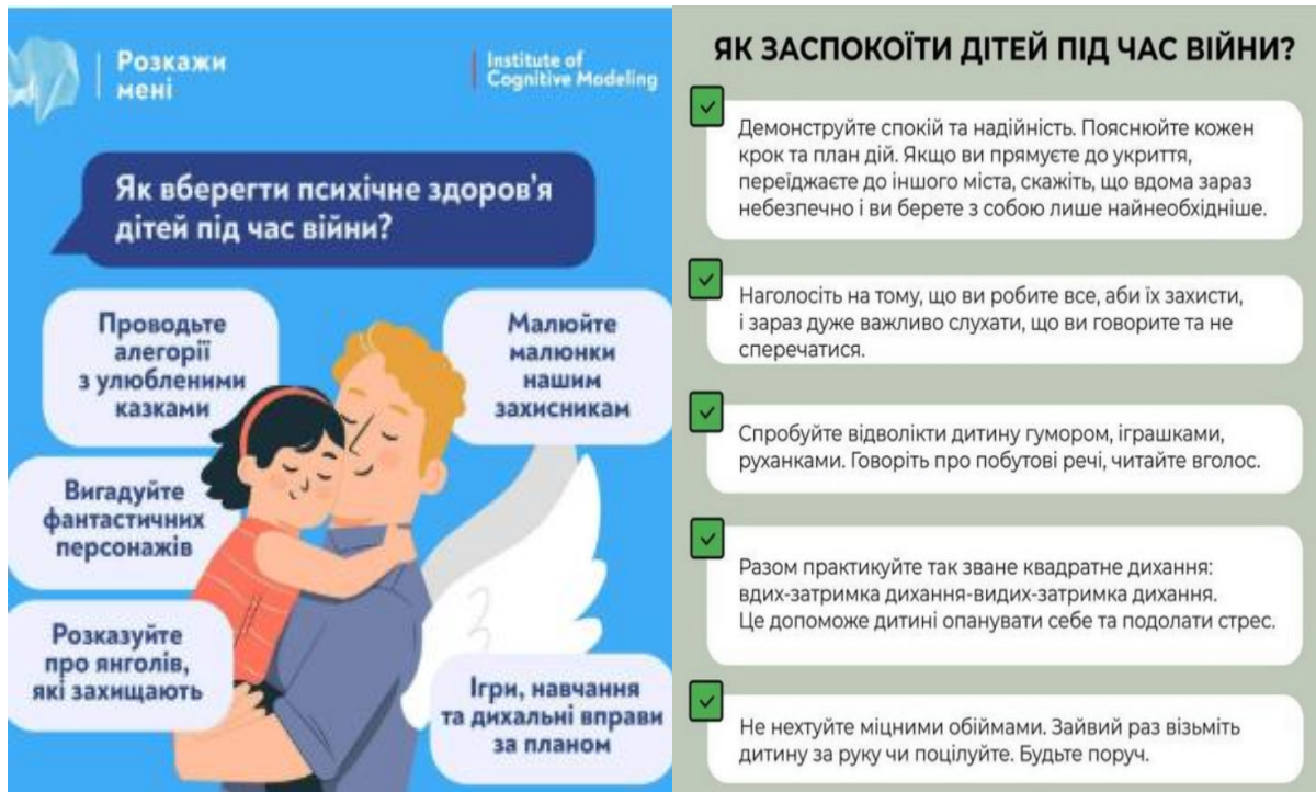
Рис. 2.6. Інфографіка для використання у роботі з дітьми і батьками ВПО.