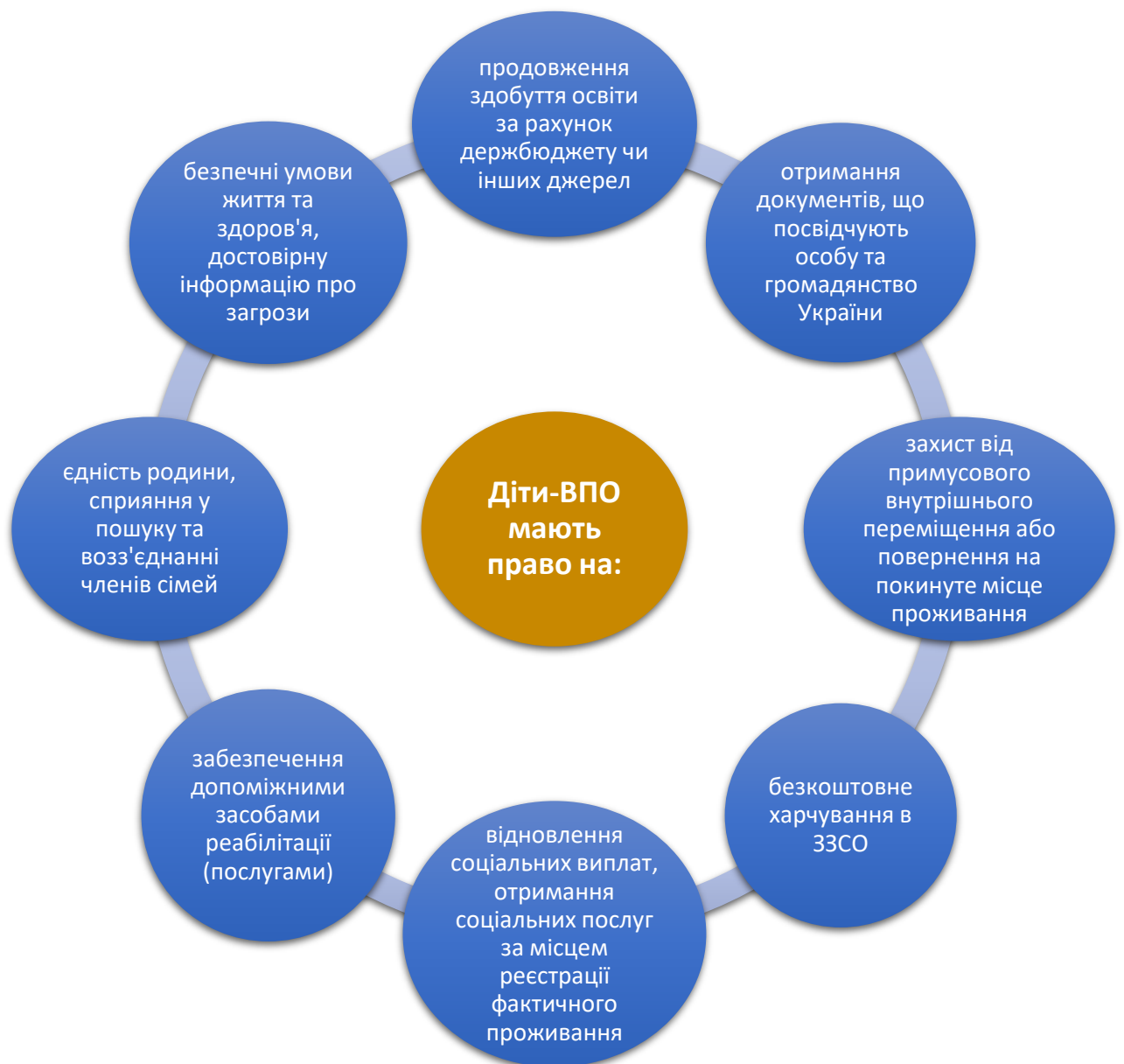
Рис. 1.4. Права дітей зі статусом ВПО.

різнобічної підтримки внутрішньо переміщеним особам (ВПО), тобто стала приймаючою стороною [40]. Адже, будучи відносно безпечним регіоном, область прийняла значну кількість родин ВПО з дітьми молодшого шкільного віку. Це зумовило появу нових викликів і специфічних завдань для системи початкової освіти області щодо ефективної інтеграції цих дітей [49].