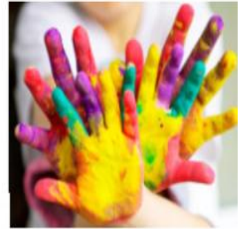
Рис. 2.3. Використання арт-терапії для соціалізації першокласників ВПО в умовах інклюзивної освіти.