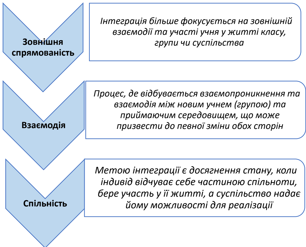
Рис. 1.6. Ключові аспекти інтеграції у контексті нашого дослідження (інтеграція дітей ВПО в ЗЗСО).