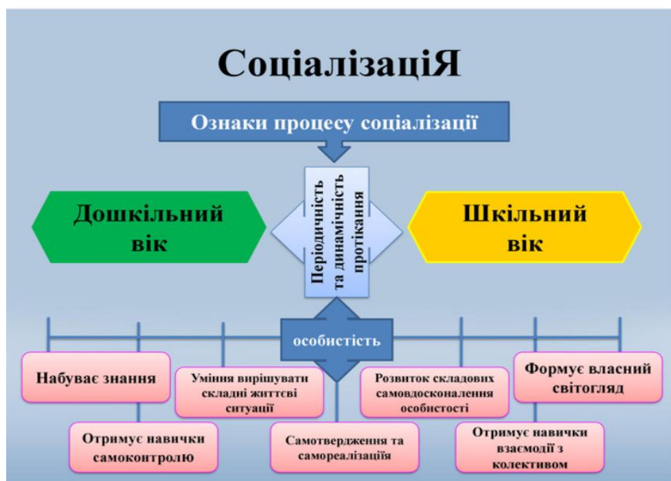
Рис. 1.1. Ознаки процесу соціалізації.

Крім того, важливо враховувати у вихованні питання наступності в цих процесах, зокрема коли йдеться про дошкільний і молодший шкільний вік [14]. Тому на наступному рисунку нами подано ознаки процесу соціалізації, що є дієвими для врахування у роботі вчителя початкових класів, коли йдеться про першокласника в школі (рис. 1.1).