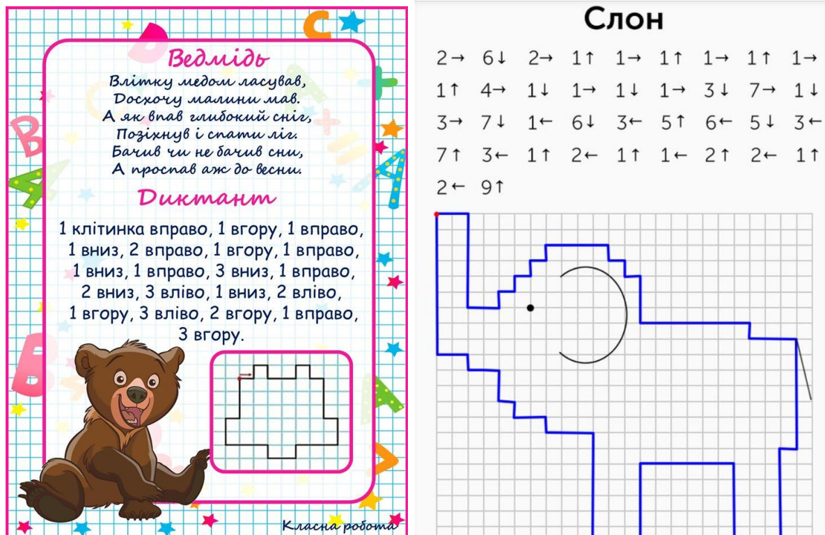
Рис. 2.1. Графічний диктант для учнів 1 класу.

Ресурс: https://shkolyar.org.ua/stattya/hrafichnyy-dyktant-dlya-pershoklasnykiv/ , https://vseosvita.ua/library/grafichni-diktanti-dla-persoklasnikiv-222734.html