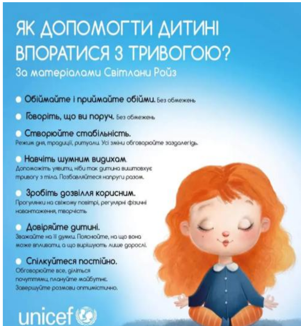
Рис. 2.5. Інфографіка для роботи з першокласника із родин ВПО