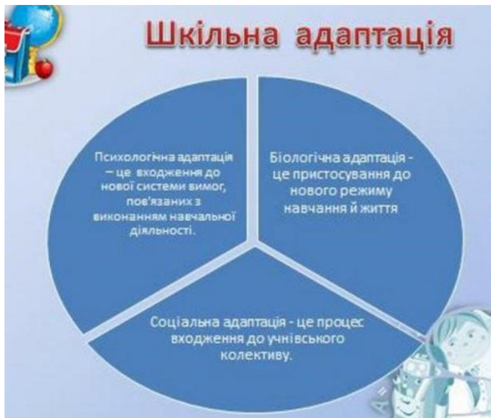
Рис. 1.5. Модель шкільної адаптації учнів 1-го класу.

Нарешті, соціальна адаптація є кінцевим етапом загального процесу адаптації, який забезпечує інтеграцію дитини до учнівського колективу та досягнення її загального добробуту в шкільному середовищі. Це включає пристосування до вимог усіх соціальних груп, характерних для школи [1].