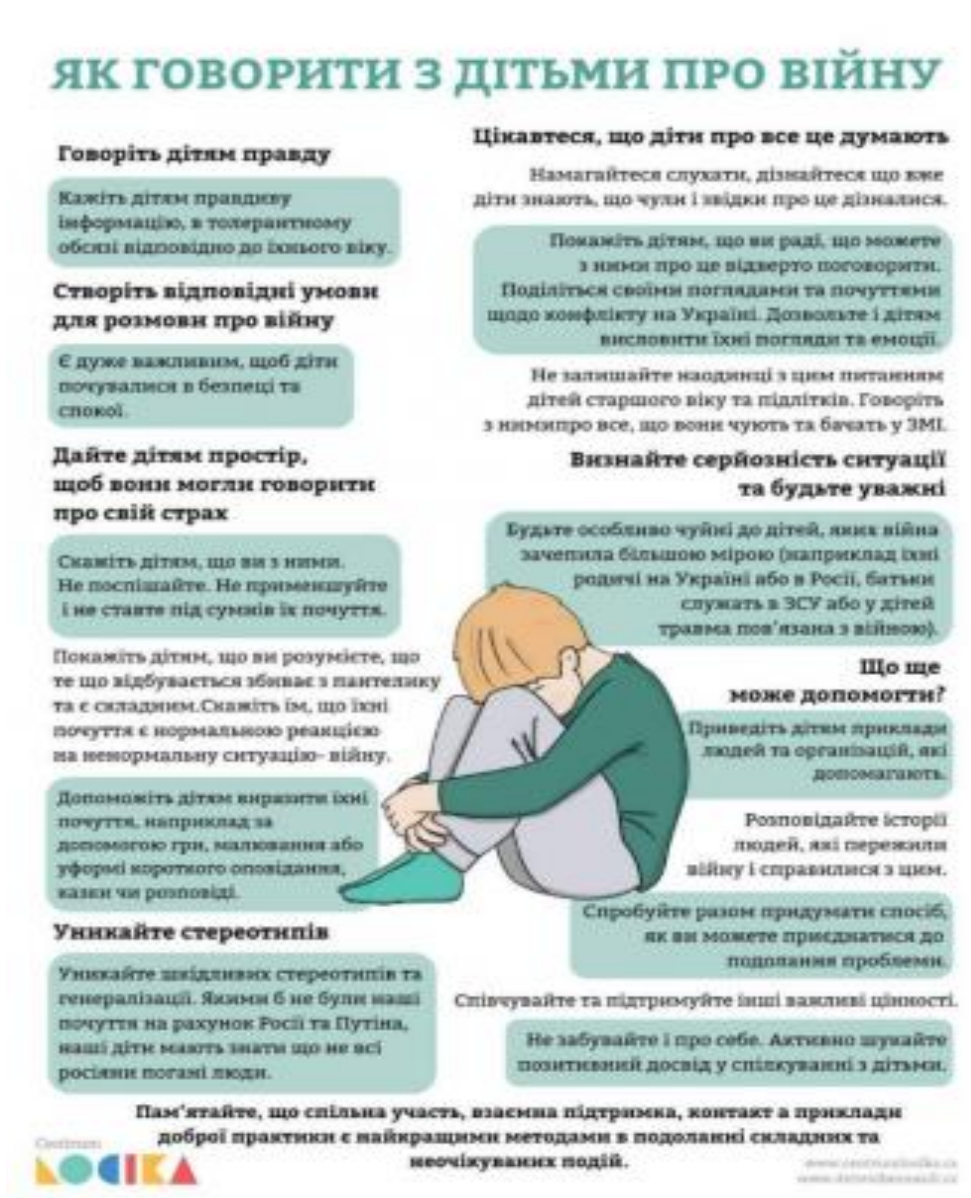
Рис. 2.4. Матеріали для роботи з батьками і першокласниками ВПО.

почувається або що приносить із собою на урок (можна використовувати м'яку іграшку, яка «дає право голосу»). При цьому теми мають бути простими, позитивними, з поступовим переходом до глибших переживань (але без тиску) (рис. 2.4).