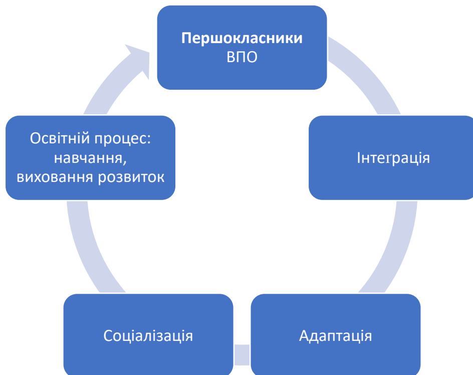
Рис. 1.3. Понятійно-категоріальний апарат дипломного дослідження.

інтеграції у середовищі однолітків у класі. Якщо дитина ВПО не зможе ефективно спілкуватися, розуміти правила та відчувати себе частиною колективу, її інтеграція буде істотно ускладненою [33]. А власне інтеграція є індикатором досягнення адаптації та соціалізації [1]. Коли першокласник у класі вже у перші тижні інтегрований, це означає, що він успішно пройшов попередні етапи, про які згадувалося вище.