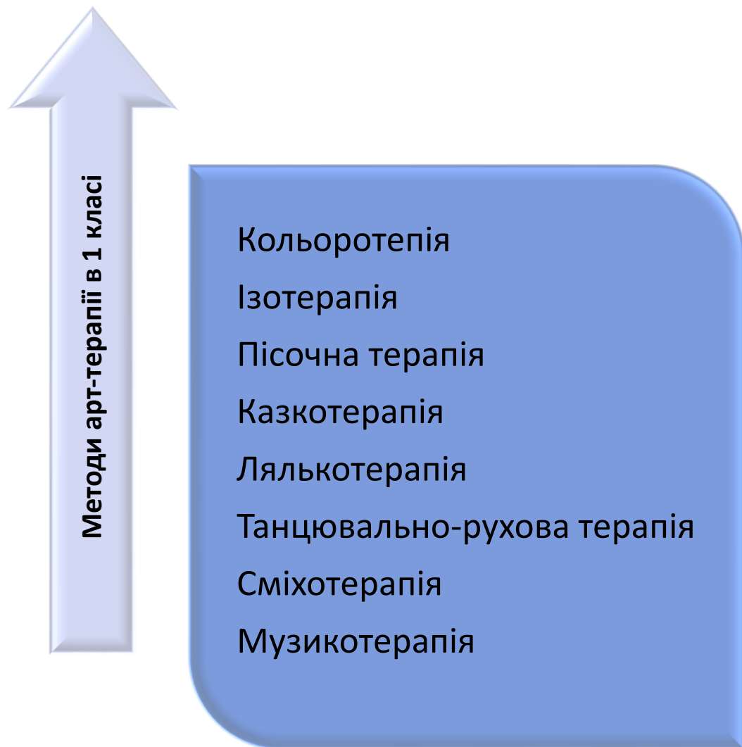
Рис. 2.2. Методи арт-терапії для роботи з першокласниками ВПО.