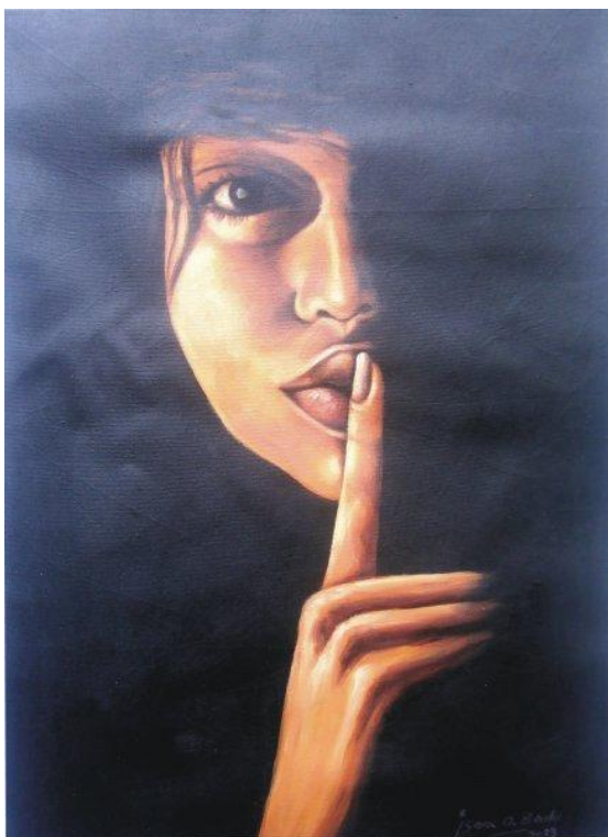
Картина «Тиша будь ласка» (Isaac Oropku Badu)

У певний момент може знадобитися трохи завмерти, натиснути кнопку “стоп”. Навіть в часи, коли всі вкрай залежні від оперативної інформації, об'єм даних треба регулювати. Постійно на зв'язку потрібно бути із рідними, новини та дописи в соціальних мережах читати цілодобово не потрібно. Надлишок фактів, більшість з яких або не підтверджена офіційно або просто є власною думкою дописувача, втомлює мозок, перевантажує свідомість. Людина перестає швидко аналізувати, отже, швидкість реакцій на ситуацію погіршується.