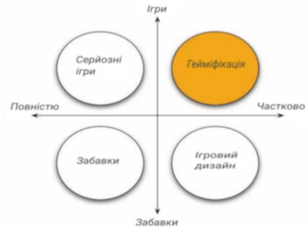
Рис. 1.7. Концепти ідеї гейміфікації.