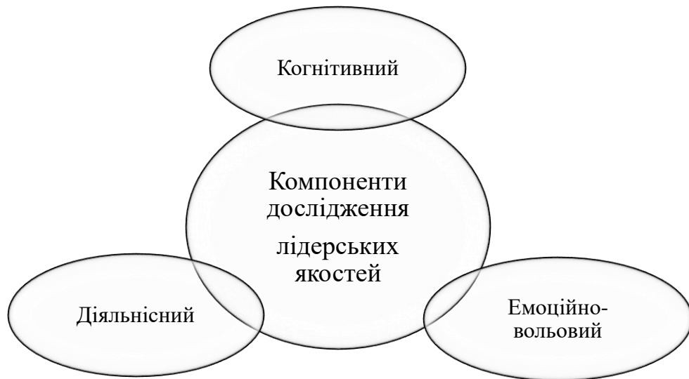
Рис. 2.3. Компоненти дослідження лідерських якостей здобувачів початкової освіти [43]

Для комплексного дослідження з розвитку лідерських якостей здобувачів початкової освіти засобами медіа-освіти доцільним вбачалось розкриття трьох взаємопов'язаних між собою компонентів (їх схематично та наочно показано на рис. 2.3).