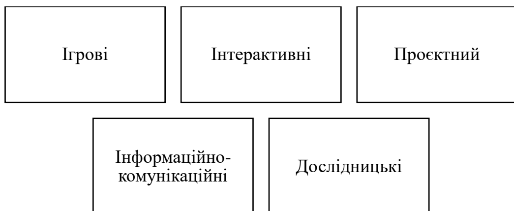
Рис. 2.2. Методи формування лідерських якостей [46]

Поряд з поданими формами організації навчального процесу важливими є методи формування лідерських якостей у процесі медіа-освіти, без яких неможливо вдало все організувати (рис. 2.2).